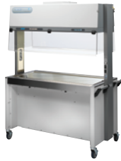
オープンアクセスステーション (OAS型)